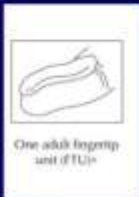
One adult fingertip unit (FTU)